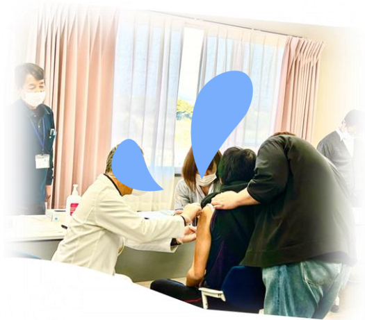
2回目ワクチン接種