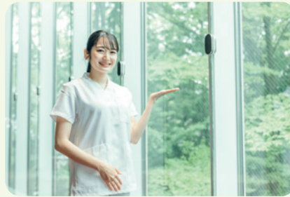
生活支援員・看護師をはじめとした 専門職員が利用者さまをサポートします

アットホームな環境での共同生活。 バリアフリーに対応しておりフラットで 住み心地の良い環境です。